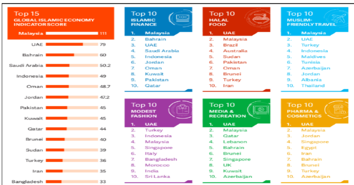
Gambar 1. Lanskap Perkembangan Ekonomi Syariah Indonesia di Tingkat Global

Di sisi lain, Indonesia memiliki posisi strategis sebagai penghubung dalam global halal supply chain . Hal ini mengharuskan adanya pemetaan strategis terkait fasilitas pergudangan, sistem pendinginan, proses pengolahan, serta pengemasan produk, hingga aspek legalitas dan standar halal yang diperlukan untuk ekspor ke berbagai negara. Berikut adalah posisi ekonomi syariah Indonesia di tingkat global.