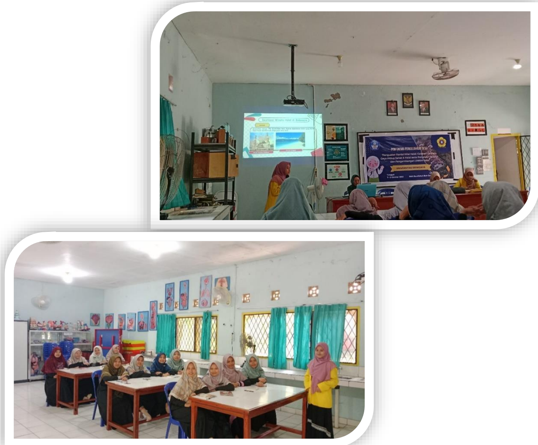
Gambar 7. Pengembangan dan Pengelolaan Pariwisata Halal