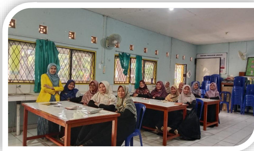
Gambar 6. Edukasi dan Diskusi Sertifikasi UMKM Halal dan Ekonomi Digital