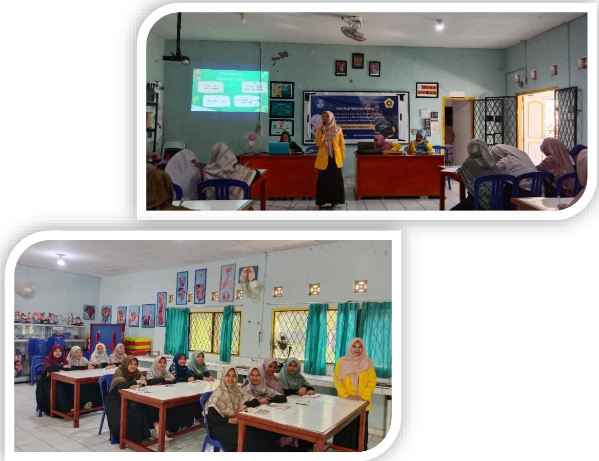
Gambar 5. Edukasi dan Diskusi Interaktif: Kosmetik, Obat-obatan dan Fashion Halal

menggunakan mukena yang bersih, tidak berbau, dan tidak meninggalkan noda hitam di bagian kepala.