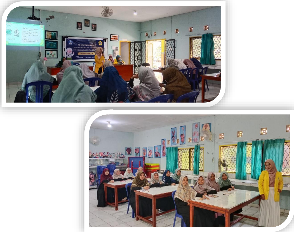
Gambar 4. Edukasi dan Diskusi Interaktif: Makanan & Minuman Halal

problematika sampah plastik, kebakaran hutan, dan food waste juga ikut didiskusikan dalam sesi tersebut.