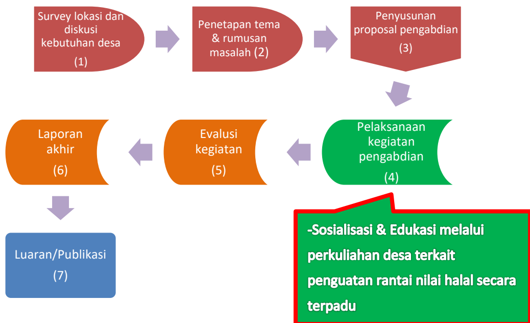
Gambar 2. Bagan Alur Tahapan Pelaksanaan Pengabdian

Adapun alur tahapan pelaksanaan kegiatan pengabdian kepada masyarakat dijelaskan sebagai berikut: